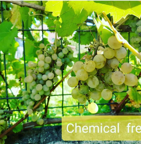
Les gusta a construíndosonos y 29 personas más ceipnumero1tui Uvas de primeira calidade libres de produtos químicos #comisiónhuerto #ecologico