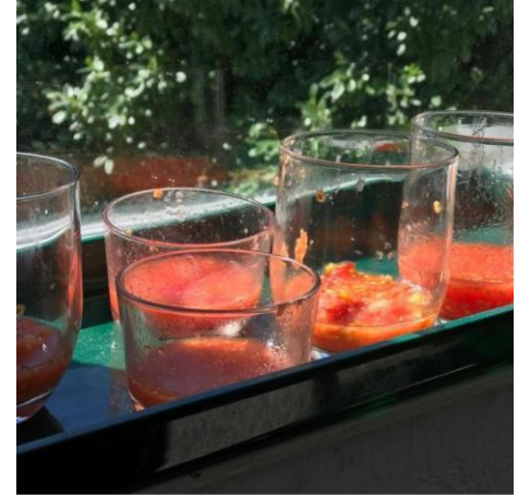
Les gusta a construíndosonos y 59 personas más ceipnumero1tui Na clase de Segundo recollemos tomates que plantamos no pasado mes de abril e hoxe comezamos a preparar as sementes para plantar a próxima primavera . Paso 1: poñer as sementes e o seu zume nun tarro de cristal e deixalas 3 días fermentando na ventá.